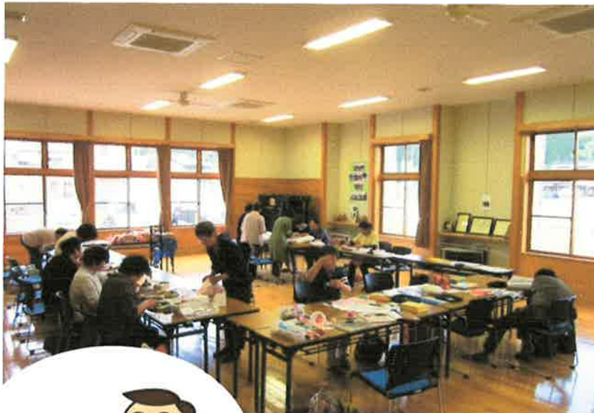
それぞれの作業に取り掛かる受講者