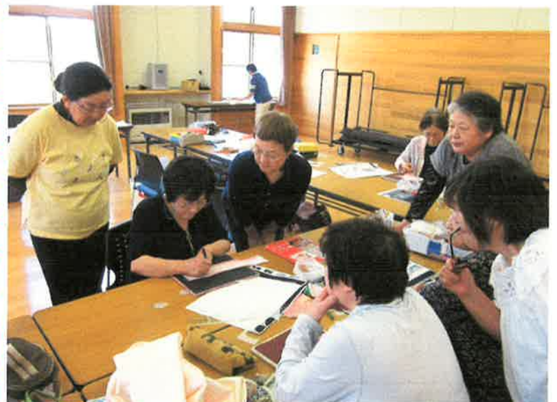
菊池先生の指導を受ける受講者