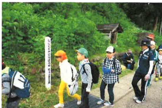
頂上をめざし いざ出発