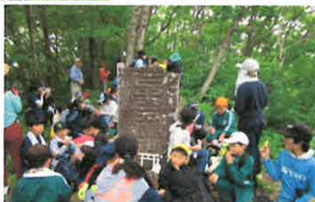
山頂で休憩する子どもたち