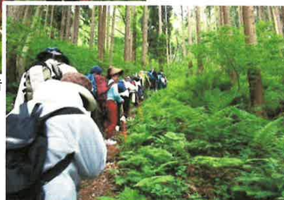
きつい急斜面 ガンバレ!