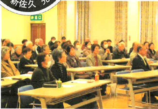
講義に耳を傾ける学生