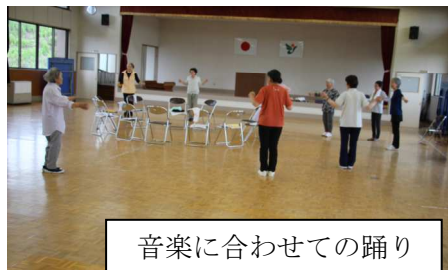
音楽に合わせての踊り