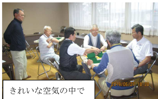
きれいな空気の中で