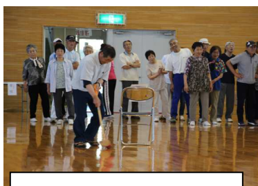
グラウンドゴルフボール送り