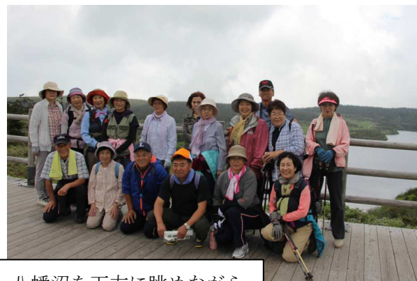
八幡沼を下方に眺めながら