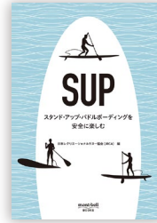
SUP JRCAs編 モンベルブックス・刊/¥990(税込)