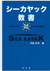
シーカヤック教書 内田正洋・著 海文堂・刊/¥1,540(税込)