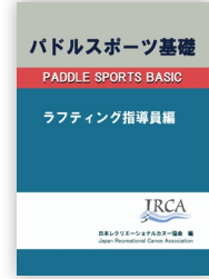
パドルスポーツ基礎 JRCAs編 JRCAs事務局・刊/¥1,980(税込)