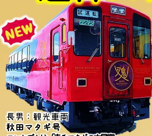
長男：観光車両 秋田マタギ号 コンセプトは「走るマタギの古民家」