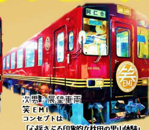
次男：展望車両 笑EMI コンセプトは「心揺さぶる印象的な秋田の里山体験」