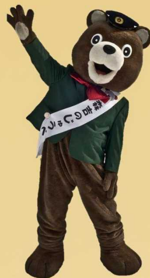
秋田内陸線公認キャラクター 森吉のじゅうべえ

おすすめは秋田内陸ツーデーパス ¥3,500で2日間全線乗り放題♪ 秋田内陸線Webページをご覧ください↓