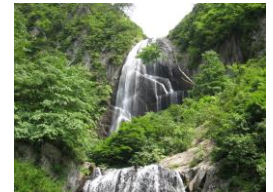
安の滝 (中ノ又溪谷)