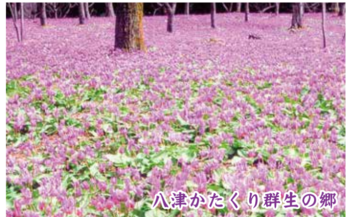
八津かたくり群生の郷