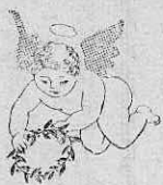
赤ちゃんコンテスト

従来戦死者慰霊祭は大阿仁阿仁合の両地区でそれぞれ施行されて来たものであるが、本年度からは両地区合同にして行なう事になったものである。