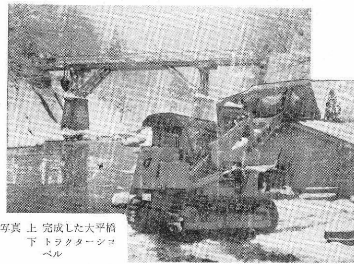
完成した大平橋 上 トラクター 下 ショベル

皆様御承知の通り銅は昨年四月より貿易が自由化されておりましたが、この自由化は、外国の安い銅と競争してゆかねばならない宿命を背負っており、外国の銅は鉾山の規模が大きく且つ品位が高いため生産コストは非常に安く国内銅と比較して一七二万円以上の差があります。業界としてはこのままの状態で自由化された場合国内の銅山の大半は閉山せざるを得ない状況であるため、昨年末政府に対し国内銅山保護のため鉾山政策の確立を強く要望してきた次第であります。 政府におきましても地下資源の保護のため「金属鉾山」探査補助金の増額、「金属鉾山」等の保護政策を実施しておりますが、業界の要望事項についてはまだ十分でなく更に引続き保護政策の強化を要望しているわけであり、昨年より本年にかけて探査の成果も挙げて