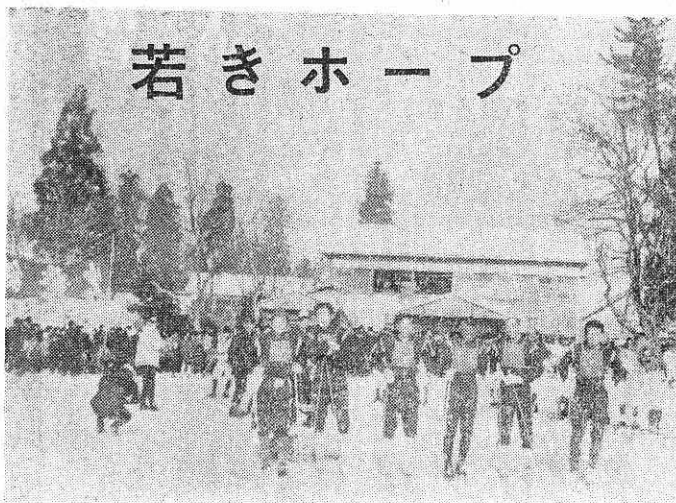
阿仁部学童スキー会場における鷹農の各選手