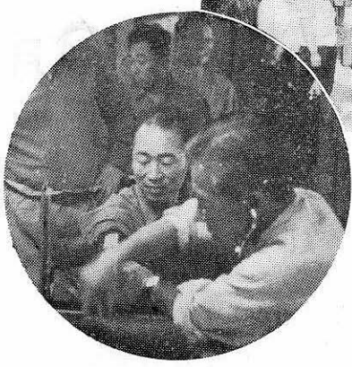
役場前での献血→ 鉾山での 各職場ごとの献血↓