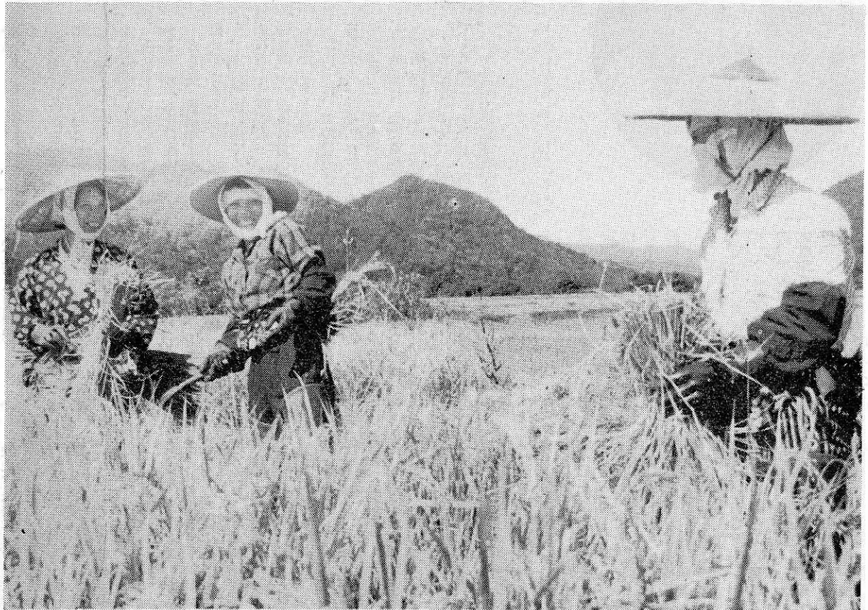
(比立内での刈取り作業)