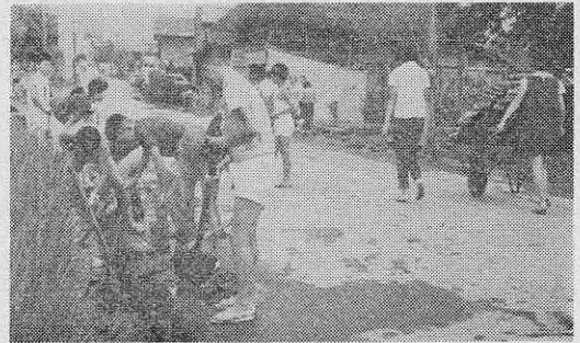
清掃奉仕の中学生

後、部落内の国道の測溝の清掃を実施しました。道路延長約八百米の両側の下水の泥あげを、それぞれの分担をきめて、各自がスコップや一輪車を持ちより、夏休み期間中実施したもので