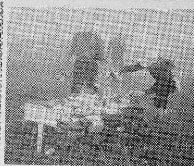
ヤマは泣いている 森吉山の美化に協力を

九月には、県立公園に指定されるといふ森吉山が、最近こゝろないハイカーのために泣かされています。 山頂や神社のまわりには、紙クズやあきかん、ビンなどが投げ捨てられており、また、高山植物として保護されているモロピヤ、ハイマツが折られたり、