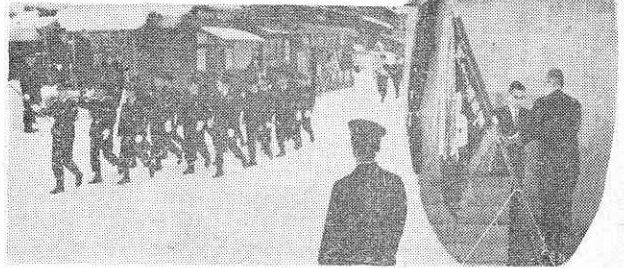
町内パレードと表彰