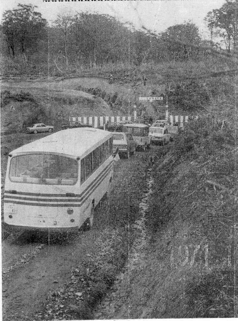
10月14日 プナ林に囲まれた郡境での開通式