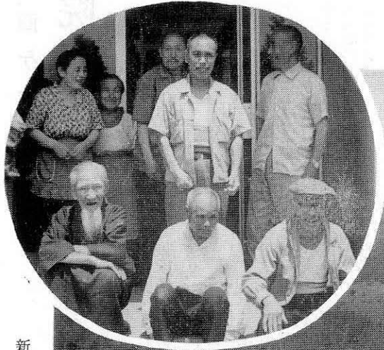
新装のホームで喜びのおとしより