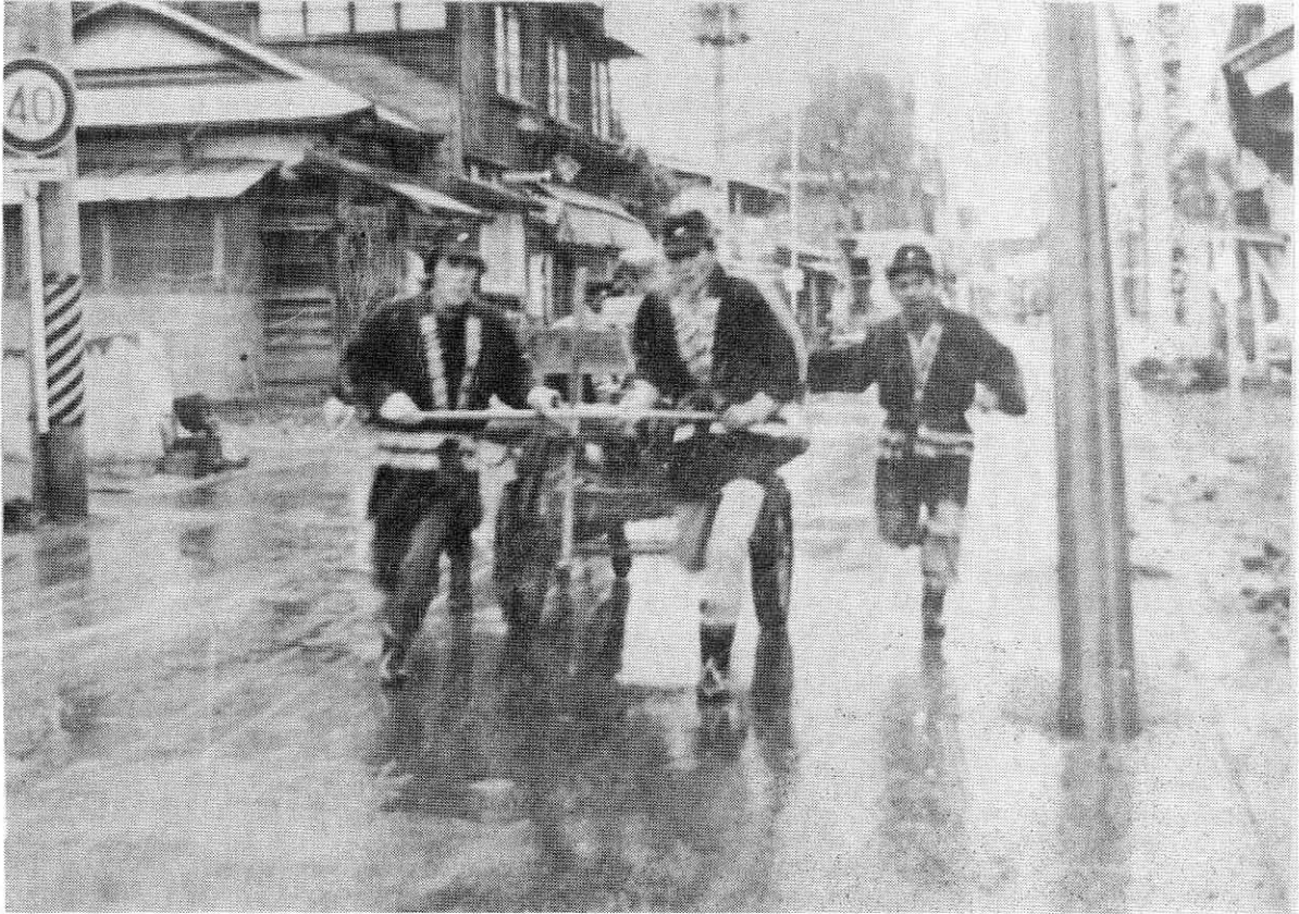
11月10日、みぞれの降る寒い朝、火災発生駆けつけ訓練で現場に走る第二分団員