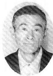
昭和十四年四月大阿仁村

昭和十四年四月大阿仁村 消防団員、昭和三十四年阿 仁町消防団班長、昭和五十 四年三月消防団部長で退 団。日本消防協会会長賞、秋 田県知事賞を受賞。 大正七年五月十八日生。