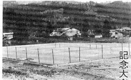
記念大会 吉川チーム優勝