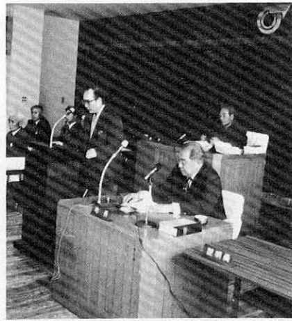
菊地収入役ののさつあい選任されて