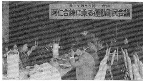
センターで開かれた町民会議

廃止線の選定基準となつてゐる一日一キロ当りの輸送密度二千人を確保する以外に、町民の理解と協力により、町民総参加による乗車運動を実施するために開かれたものです。 後日、乗車運動を推進するための特集号を各家庭に配布して協力をお願いしますが、会議で決つた主な事項をお知らせします。 ▽毎月一日と十五日（交通安全の日）をノーカーデーとする。 ▽町主催の会議は、汽車時間に合せて開く。 ▽福祉バスの利用には一定の区間、汽車利用の条件をつける。 ▽各家庭で乗車実績表を記録して家族ぐるみで意識を高める。 ▽阿仁合線に乗って来町した観光客に特典を与える。