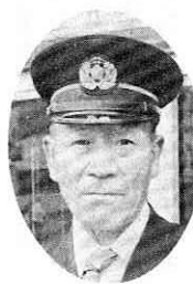
昭和十四年四月大阿仁村

昭和十四年四月大阿仁村 消防団員、昭和三十年阿仁 町消防団班長、消防団部長、 消防団副分団長、昭和五十 四年三月消防団分団長で退 団。日本消防協会会長賞、秋 田県知事賞、消防庁長官賞 勲八等白色桐葉章（軍歴関 係）を受賞。 大正七年五月十八日生。