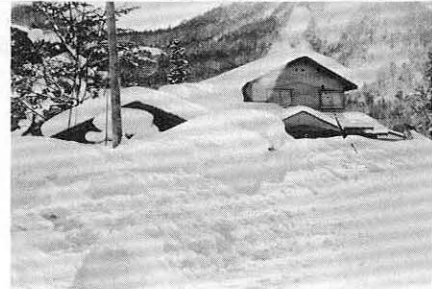
（軒先まで雪におおわれた民家）