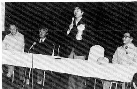
国士計画株式会社社長