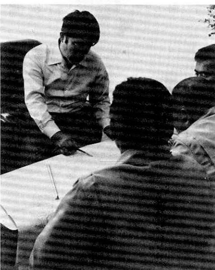
両町長と図面を見ながら話し合い

開発センターで開かれた歓迎会のあいさつでは、百名を越す両町関係者を前に「スキー場としての山に第一回目の合格点が出て、今はこうして皆さんと会って更に確信を持った」と先ずはうれしい発表、「開発のピッチはそう早くはないので、皆さんも長い目で見たい。いいスキー場を作る事を第一に考えているが、この山は皆さんの山なので、皆さんが自分の開発だと思