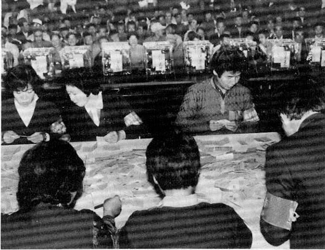
多数の町民が見守る中で 行なわれた開票風景 (町民体育館)

町づくりの期待をこめ、新しい町政のない手、十八人の議員が選ばれました。 任期満了に伴う町議会議員選挙は、十五日告示、十六日午後五時に締め切れ、議員定数十八人に対し二十一人（現職十四人、新人六人）が届け出をし、以後一週間、少数激戦の選挙戦が展開されました。 開票の結果、新人五人を含む十八人の選良が誕生。今後四年間、六千人市民の代弁者としての活躍が期待されます。