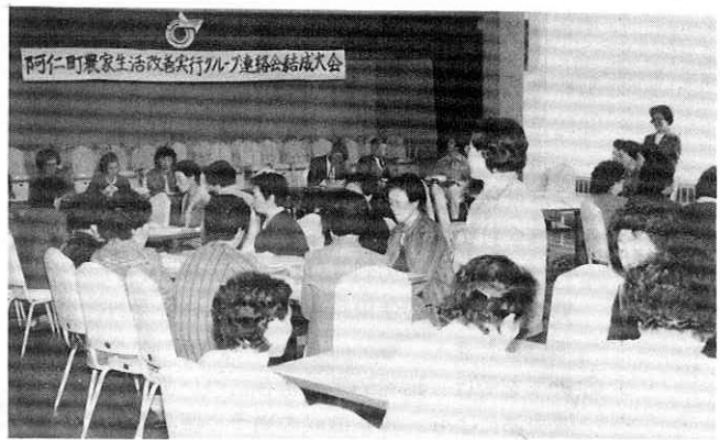
グループ紹介をする会員の皆さん