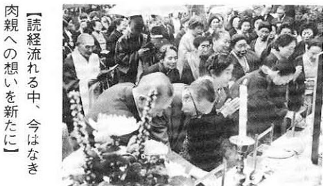
【読経流れる中、今はなき肉親への想いを新たに】

植樹後の懇談会場となった吉田堤には、ちょうど遅咲きの桜が満開でしたが、今回、この桜の植栽、管理に精を尽くしてこられた吉田部落に、財団法人日本さくら会から表彰状が贈られることになり、この日町長から伝達されました。