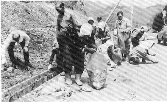
国道バイパスの空缶拾いをする、荒瀬老人クラブの皆さん、20枚の袋はたちまち一杯こ。