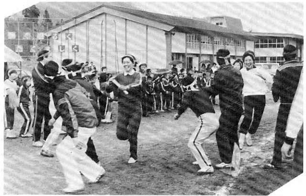
▲若いPTAのお父さん、お母さんの大ハッスルが目立った阿仁合小。