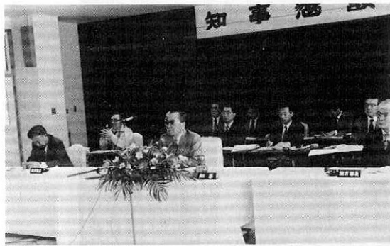
知事との行政懇談会

県知事の阿仁町訪問は一昨年八月以来のこと、過疎脱却をめざす町にとってはまたとない機会と考え、町の実情を強く訴えて、県の理解と支援を求めました。