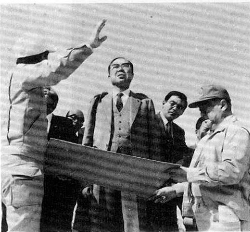
〔森吉山ブナ帯に着き、スキー場予定地について町の説明を聞く佐々木知事〕