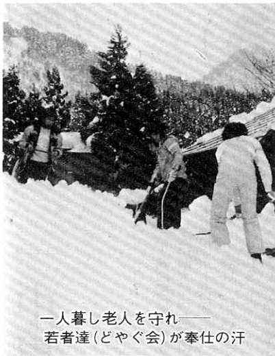
一人暮らし老人を守れ—— 若者達(どやぐ会)が奉仕の汗