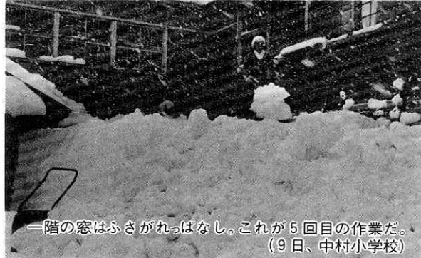
一階の窓はふさがれっぱなし。これが5回目の作業だ。(9日、中村小学校)