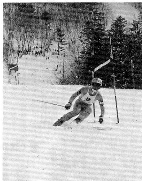
写真 上 中学校男子リレーのスタート 下 中学校男子大回転

第二十九回阿仁部学童、第三十六回大館市北秋田郡中学校スキー大会が十一、十二日の両日、阿仁スキー場で行われました。大会前日までの猛寒波も開会式には見事に晴れ上がり、小学校二十二校千二百十三人、中学校十五校三百五十名が参加してのマンモス大会の幕が開きました。第一日目の競技は、アル