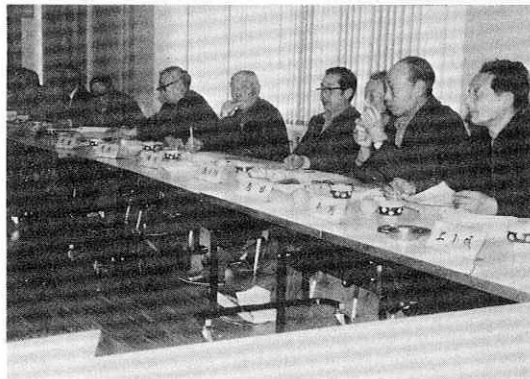
多用途米配分方法などについて熱心な議論が交わされた

一般作物扱いになったこと、農協等への水田の預託期間が連続六年までが、連続三年までとなったことなど、なっており、出席した各委員は、厳しい表情で町側の説明を受けていました。 この協議会で第三期対策の一定方向がうち出されたことから、町では三月上旬に全集落で座談会を開催、各農家毎の配分目標面積を示しながら、集落内達成のための協力を求めることにしています。