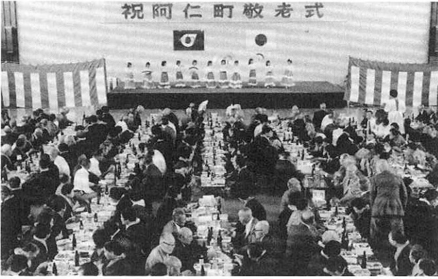
シルバーパワー一色の敬老式

出席のお年寄りたちは、久しぶりの再会に、お酒を酌み交しながらかなごやかに談笑。アトラクションの阿仁合、大阿仁両保育園児のお遊戯や、婦人会の皆さんの唄と踊りのサービスに、敬老の一日をゆっくりと楽しんでいました。