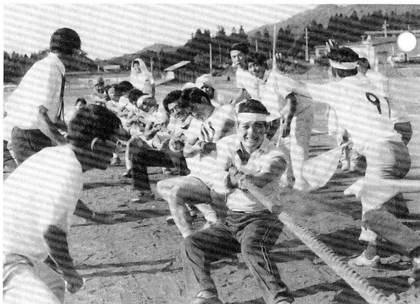
選手・応援団が一体となって熱戦を展開した 今年は、男子は「比立内チーム(左)」