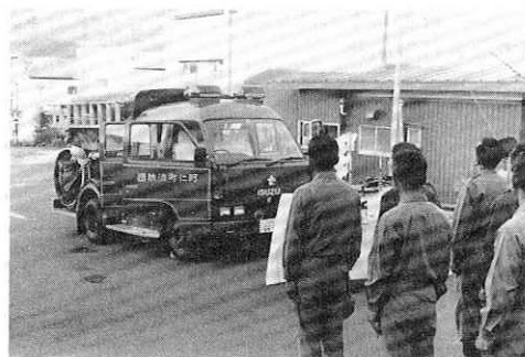
▶新しいポンプ自動車の入魂式

新しいポンプ自動車は、協立株式会社製で、イズズ自動車のボディに森田式C D I型消防ポンプ等を装備した最新式で、千八十五