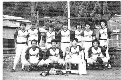
▶開幕戦を飾ったドリinkerズ

町内社会人野球の幕開けとなった、阿仁町野球連盟主催大会の決勝戦が六月二十九日、町民グラウンドで行われ、ドリinkerズが優勝して、開幕戦を飾りました。