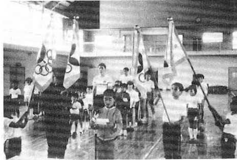
▶四団が参加して、スポ少入団式