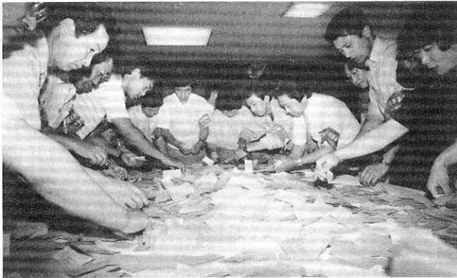
衆・参同日選阿仁町選挙区の開票(開発センター)