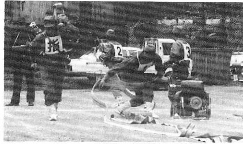
▲キビキビした動作の小型ポンプ操作

阿仁町消防団恒例の、小型ポンプ、自動車ポンプの操法競技会が十三日、阿仁一中グラウンドで行われました。