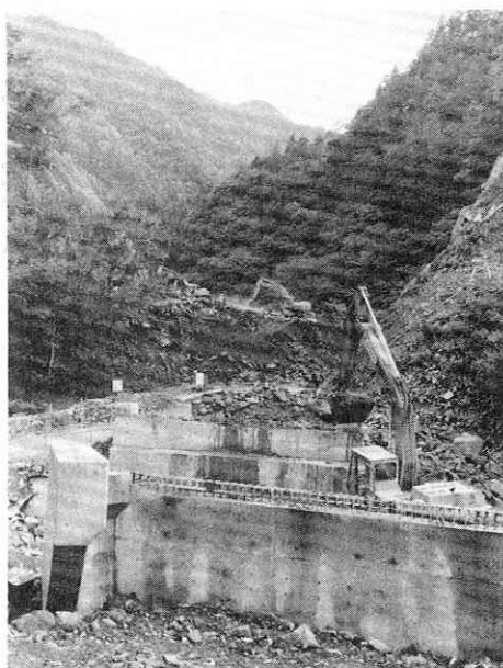
スキー場アクセス道路として工事が急ピッチで進められている町道荒瀬川線

過疎代行の小倉沢林道開設工事は、三月下旬延長七百八十七メートルが発注され、施工中です。今秋には、全体延長五千四百七十メートルの見込みで、小倉から戸島内までの森林地の環状線が誕生します。広域基幹林道の事業採択については、県と町で現地踏査、資料の作成等に努力しているところです。また、林野庁の現地調査が六月に行われることになっています。