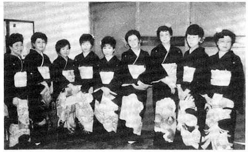
女性達が留袖姿で出席した年祝い＝比立内＝