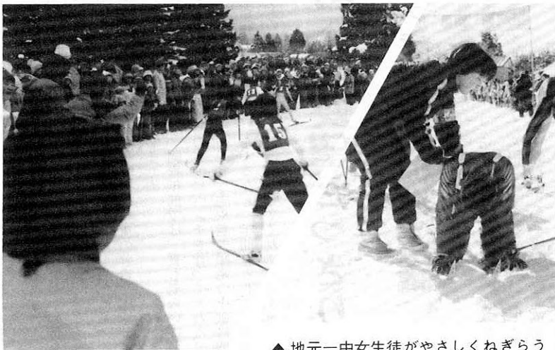
▲ 地元一中女生徒がやさしくねぎらう