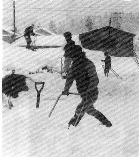
屋根まである雪をスノーダンフでよせる若者達