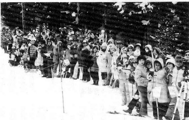
▲ 回転ゴール付近で、お目当ての選手を待つ観衆