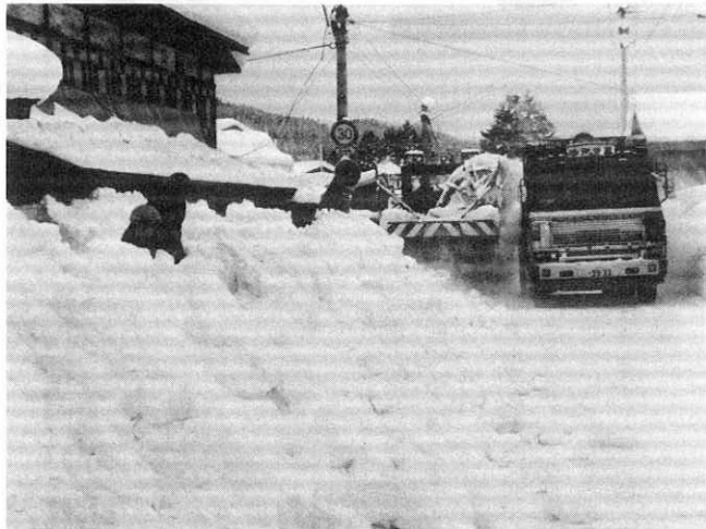
雪で狭くなった道路はダンプカーで排雪(水無の国道で)