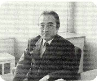
秋田内陸縦貫鉄道(株)本社(県庁)で

交通図書賞受賞の「無事故への提言」など著書も八冊。剣道、スキー、水泳、テニス、ゴルフと何でもこなすスポーツマン。阿仁町には旧制大館中の同輩など知人もいて、何度か来町済み。現在は秋田市に住んでいるが、将来は阿仁町へ。六十四歳。