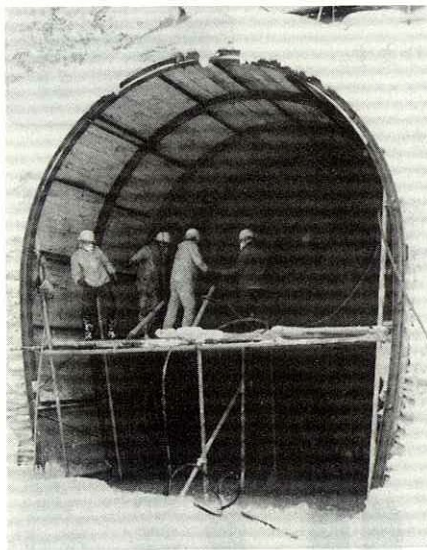
64年春全線開業に向けて、寒風をついて工事が急ピッチ。23日現在=34mまで掘り進んでいる