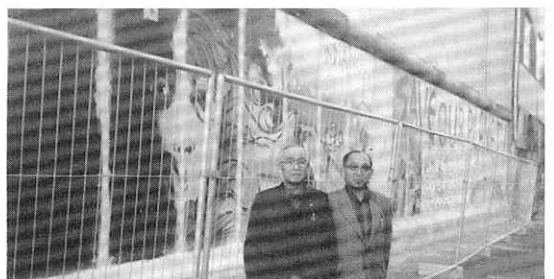
10/17 ドイツ ベルリンの壁をバックに

ヨーロッパ八ヶ国に延々とつながるドナウ河、西はオーストリア、東はルーマニア、南には国内紛争が続くユーゴスラビア、北はチエコスロバキアと国境を接してゐるドナウベンドと呼ばれドナウ河全流域の中で最も美しいところである。ブタペストから北上し、西にカーブしてエステルゴムに向う沿岸は起伏に富んだハンガリー史上で数多くの出来事の舞台となり現在多くの観光客が自然と芸術、民芸やごちそうにひかれてここを訪れてゐるそうである。かつてのハンガリー王朝のあつたエステルゴム、マーチャーシユ王により王宮が建てられたヴァイシエグラ