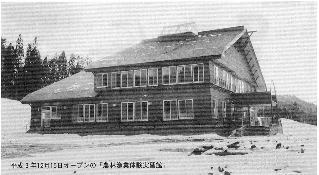
平成3年12月15日オープンの「農林漁業体験実習館」