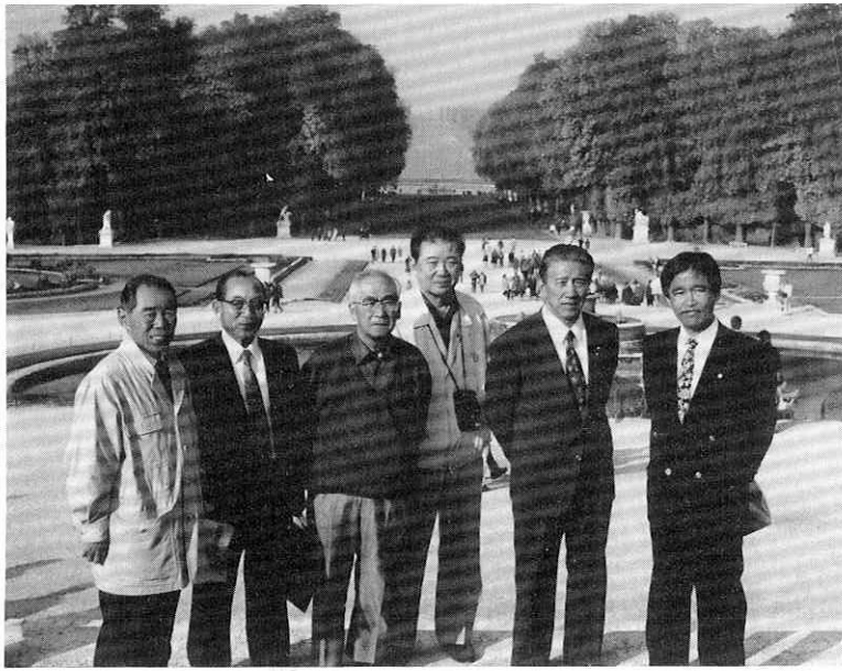
10/26 ヴェルサイユ宮殿視察 庭園をバックに

○kmで日本の広さのよ、ヨーロッパ陸地の丁度一%の広さで国土のよは平原から伏のゆるかな丘陵地帯であり、ヨーロッパにおける唯一のアジア系民族で中央アジアに起源をもつハンガリー民族(マジヤール族)