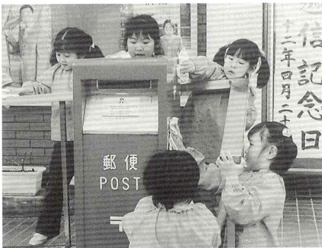
▲隅々までピッカピカ

通信記念日の四月二十日、比立内郵便局前で、大阿仁保育所園児によるポスト清掃が行われました。 事前にプレゼントされた、赤、黄、青のバケツを大事そうに持って参加した年長組の園児たちは、雑巾を手に、一日も休まないで働くポストに「いつもご苦労さん」の感謝のこたばを述べながら、隅々まで丁寧に磨き上げていました。 これは、比立内郵便局が郵便事業をより身近に感じてもらうと平成十年から行っているものです。 この後園児たちは、きれいになったポストに自分宛ての封筒を投函しながら、翌日の配達に期待を寄せていました。