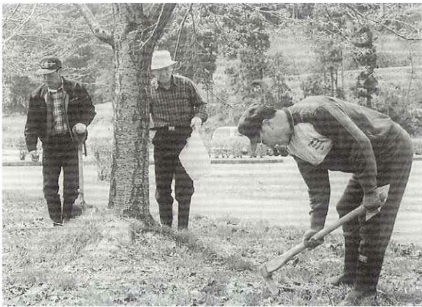
▶一本一本丁寧に手入れ

初夏をおもわせる陽気となった四月三十日、河川公園で、これまで植樹した桜の木の手入れとクリーンアップが行われました。 これは、阿仁ライオンズクラブ、あきぎんチャレンジ会、阿仁グリーンクラブが、「子ども、孫に残す町づくり」と緑地公園、河川公園に合わせて約百五十本の桜（ソメイヨシノ）を植樹し、現在は、主に追肥や草取り、ゴミ拾いなどを行っているものです。 この日は、約三十人が参加。作業に汗を流しながら、「将来はぜひ観桜会を開きたい。」と思いを馳せていました。