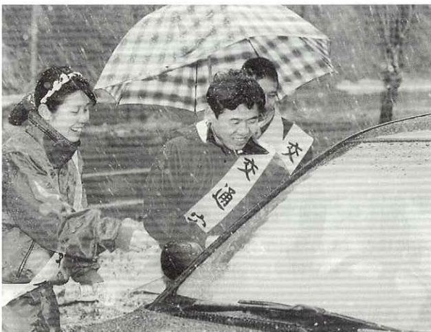
▲苑生からの優しい呼びかけにドライバーもニコリ

また、運動期間中、町内では交通安全教室や街頭指導などが展開されました。当町では、四月三十日現在、交通死亡事故ゼロ一、六五二日となっています。当面の目標である来年四月十三日の二、〇〇〇日達成に向けて、町民一丸となって事故防止に努めましょう。