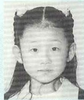
佐々木 遥 (荒瀬・久彦) 歌手