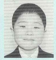
柴田 永未 (幸屋渡・栄) ニュースキャスター