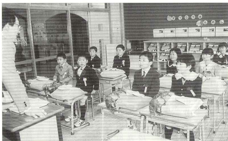
▲先生のお話へ耳を傾ける(大阿仁小学校)