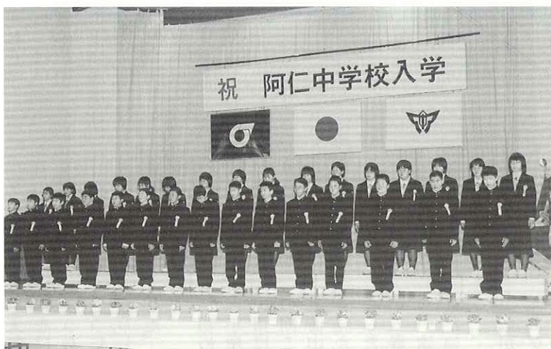
▲新入生一人ひとりを点呼し紹介しました。(阿仁中学校)