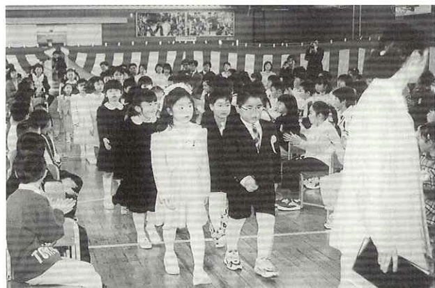
▲たくさんの拍手を受けて入場(阿仁合小学校)

また、4月6日には両保育所で入園式が行われ、お兄さん、お姉さんが歌や手踊りで新しいお友達を歓迎しました。