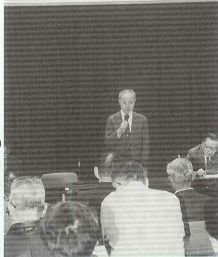
▶約50人が参加した総会