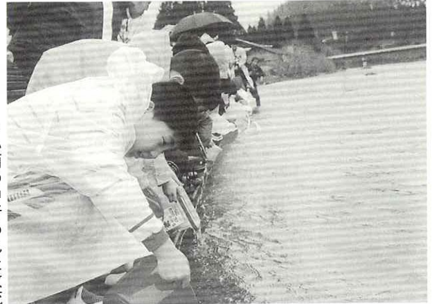
▼小雨の中行われた放流