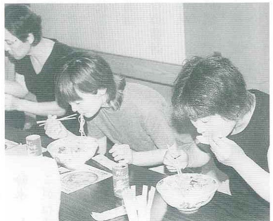
▲スープもばっちり。味噌ラーメン

「おいしい」「なかなかいい味だ」といった好評の声が聞かれました。阿仁森吉森林組合特用林産物加工所で、またたび味噌ラーメンとまたたびつけめんを開発し、試食会が七月二十四日、農村環境改善センターで開かれました。