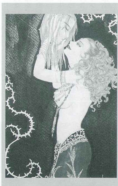
ギャラリー・アートボーン・コンテ スト冬展で入選した作品「サロメ」 ※カラー作品です