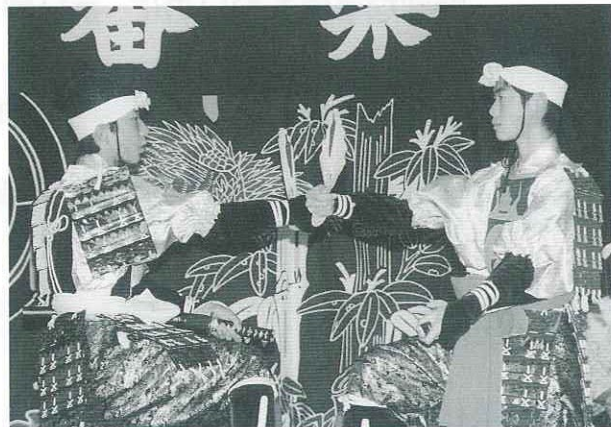
▲昨年行われた阿仁中伝統芸能発表会

当町からは8月21日に根子番楽が出演。根子、萱草、笑内地区の小・中・高校生が、露はらい、曾我兄弟を演じます。