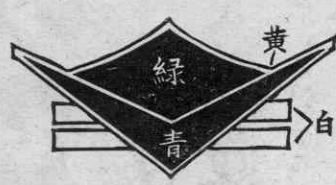
(地色は各学校毎に変える)