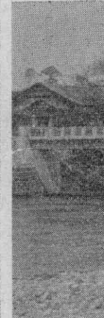
【写真—完成した新田目橋】

盛大な竣工式が行なわれた新田目橋は、約四十年にわたる流失部が修復され、四月の水害で約九百九十万円で着工、流失部分の復旧を急いでいたもので、このほど四十年が永久橋として完成した。