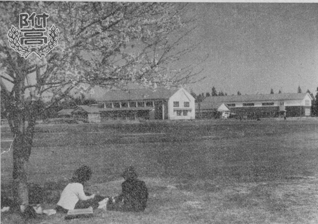
【合川高校本校舎に予定される合川中東校舎、カツトは帽章】

全校生に記念品 秋田短大付属合川高校は新学期から本町に開設されたが、合川町長は全校生徒に帽章、制服ボタン、学年章、帽子白線(以上男子)バッヂ(以上女子)を記念品として贈った。