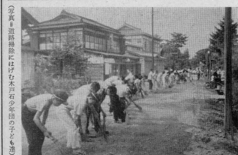
(写真) 道路掃除にはげむ木戸石少年団の子ども達

農協基盤が拡大されることにより、財務が安定するので金融面における利益の増が期待できます。