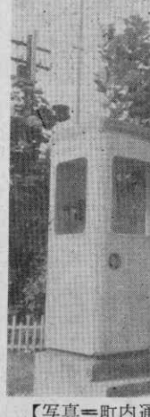
【写真=町内通話に一役かう 電話ボックス=合川駅前】

このほど合川駅前公衆 電話が架設されモダンなボ ックスがおめえし町の人 達に喜ばれています。 町の玄関口にあたる合川 駅前公衆電話を架設して