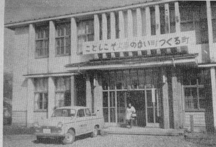
(写真=町ぐるみ無火災運動を呼びかける横断幕・役場庁舎)

町村合併以来、毎年大小の火災が発生し、その件数は十年間に四十三件、損害額は三億円のぼぼに達している。このため県内有数の火災多発町として汚名を着けていた。しかも、その発生状況は年を通じて殆んど毎月であり、その原因は、大部分が町民の警火心の欠除が大きい。