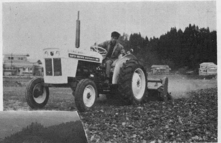
▲わずか四十分で三反歩もの耕起をやりとげる。一日に換算すると三・五ヘクタールはかたいと言っています。(耕起作業に活躍するトラクター)