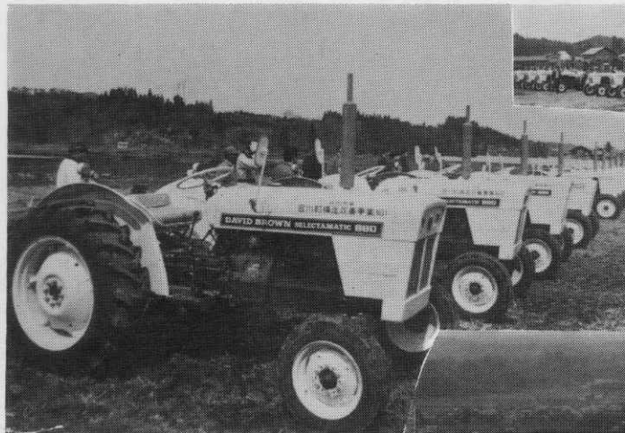
このトラクターには水そう付の動力防除機をとう載し病害虫の防除に活躍することになっています。

最近、商品としての米を農協が事業主体となって設置する計画です。作ろうということがよくわかります。また消費者からは「味のよい米」がほしいということと社会的に大きくとりざたされています。 このような状況の中で合川町の農業倉庫には、まだ昭和四十三年産米からの米が山積されています。ただ低温倉庫に保管されている米は、需要が多く以外に早く出荷されているようです。 また岩手県の夏田農協、稲瀬農協等におけるカントリーエレベーター(大規模)の利便と出荷等を調査した結果では、現年度の八月までにほとんどが「味の岩手米」として東京、大阪方面へ出荷されており、また一部は大都市の「スシ屋」へ自主流通米として直送されている実情であります。 合川町では、これからの米の需要に対応するため、第二次農業構造改善事業でカントリーエレベーター二台(米にして約三万俵)を昭和四十六年度事業で両