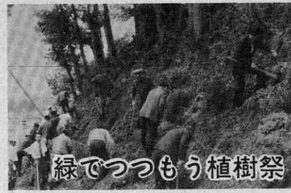
緑でつつもう植樹祭

また、擬制世帯(世帯主が社保に加入の場合)の場合は、所得割だけが軽減の対象になっていましたが、資産割についても軽減されることになりました。