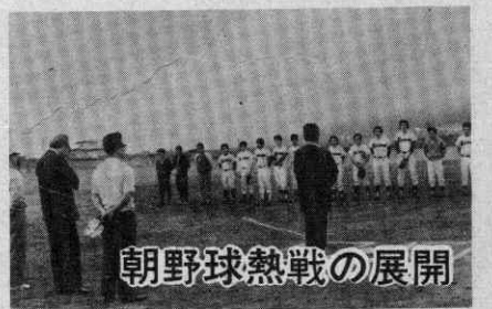
朝野球熱戦の展開

川管林署周辺において行われました。 この日植樹されたのは、色とりどりのツツジ六十本で、今後はみなさんの目をうるわしてくるものと思われま 各家庭でも一本の植樹から、うるわしい環境づくりを。