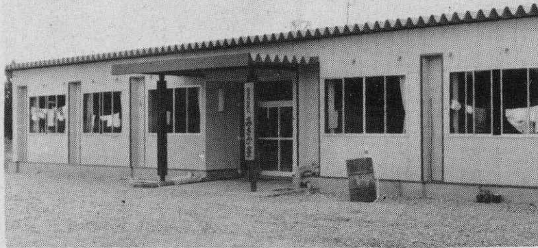
モダンなみさか通勤寮

この「みさか寮」は、精神薄弱者を職場に通勤させるが、一定期間入所させて、対人関係、余暇の活用健康などひとりだちに必要な要件を、毎日の生活をともにしながら指導していくもので、社会適応能力を向上させ、将来は円滑な社会復帰を図ることを目的としています。