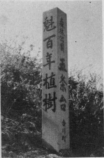
合川町森林公園「五条台」が誕生

また、当日は植樹地山柘沢地内十ヘクタールを森林公園「五条台」と命名、町民の憩の場にするこ