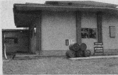
正面入口にある簡易保険の融資表示板

町では、より豊かで明るい町の発展を願って、広く町民のみならずから写真を公募することになりました。