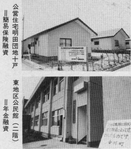
公営住宅明田団地十戸 簡易保険融資 東地区公民館(二階) 国民年金融資

町では、「簡易保険」「国民年金」の積立金から融資を受けて、毎年、大きな仕事をしています。あなたの簡易保険・国民年金が、還つ国民年金積立金還元融資元されて、私たちの暮らしに役立つわけですね。 五十年度は次の事業に簡易保険・国民年金のお金が役に立ちました。