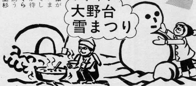
大野台つり 大雪まつり 郷土芸能・騎馬戦・ゲーム・かまくらの村・マトビ・わら、竹細工教室・馬ソリ・むいぐるみ・うさぎなべと甘酒をサービス