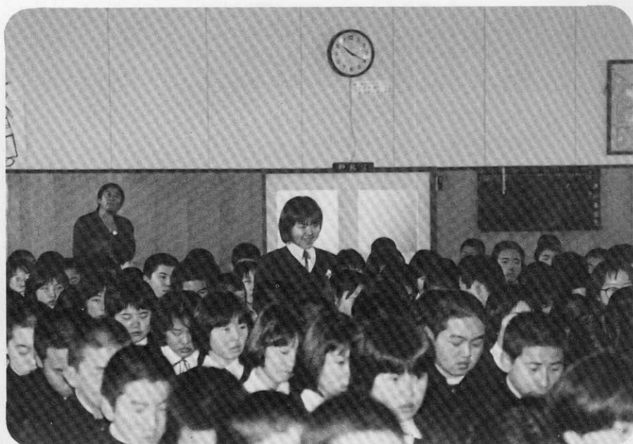
生徒間だけのあいさつではなく、もっと地域住民間とのあいさつをと。