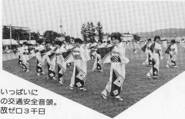
会場いっばいに 婦人会の交通安全音頭。 死亡事故ゼロ3千日 めざしてー。