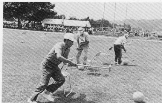
どの種目もチームワークが勝負のキメ手。 声援を受けて走れ走れー。(ゲートボールリレー)