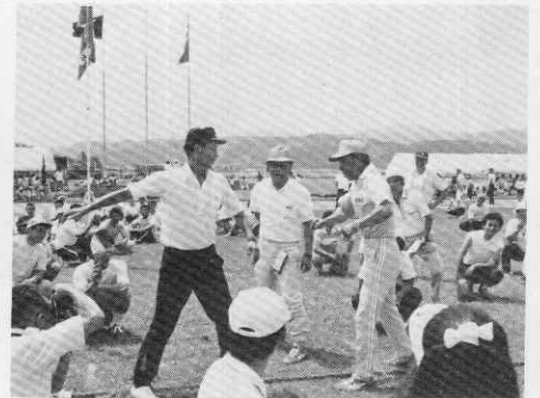
綱引き上杉-川井戦は2回の引き分け。 異例のジャンケン戦も10-10で監督決戦へ。