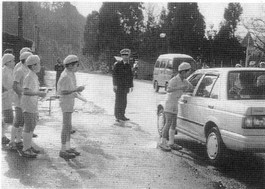
南小学校交通安全推進隊の街頭指導

春の全国交通安全運動は、四月六日から十日間にわたって展開されました。 初日の六日は、役場前で早朝安全祈願の集い。神事に続いて、森吉警察署長らがあいさつし「事故ゼロ」を誓い合いました。 期間中、大野台の里の皆さんのカーブミラー清掃奉仕、合川南小学校交通安全推進隊の皆さんの街頭指導などを実施。交通指導隊を中心に、シートベルト着用の調査指導が行われました。 各家庭には「交通安全旗」を更新して配布。毎月の交通安全日など、全町的な呼びかけに協力をお願いします。