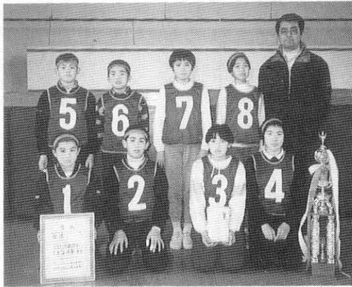
熱戦/ドッチボール大会 ⑬=優勝した 駅前Aチーム

られました。思った以上の 参加者(百名)で九チームで のリーグ戦でした。 結果は次の通りです。