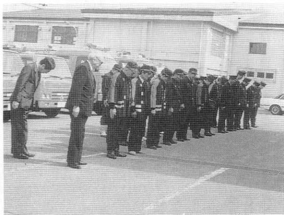
火災シーズンにむけて緊張した祈り