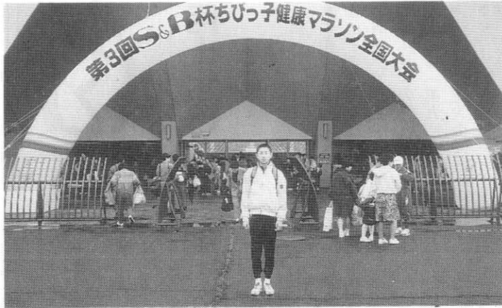
小学校卒業のすばらしい思い出に一大会会場で