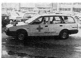
「福祉の町、の足として活動する博愛号