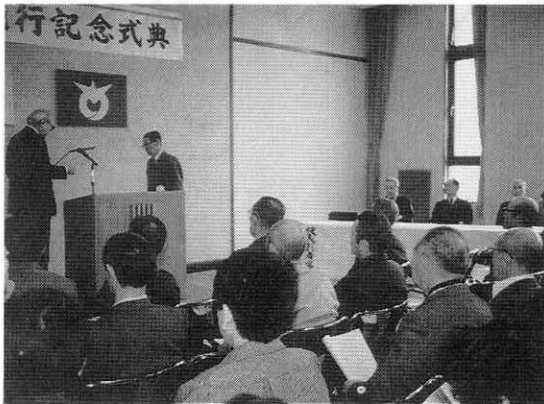
町税完納者などを表彰