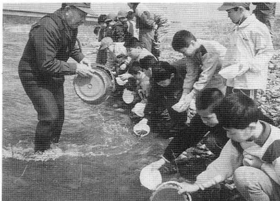
「大きく育ってね」と阿仁川で

四月九日、阿仁川に二百六十万尾のサケの稚魚が放流されました。この放流は阿仁川漁業協同組合で毎年、行っているものです。 今年の放流には合川北小学校の二、三年生が参加。バケツの中の数センチの稚魚は元氣いっぱいですが、大きな川の流れに「だいじょうぶかな」「元気で育つんだよ」「きつと帰ってきてね」などと声をかけていました。 サケが帰ってくるのは四年後。参加者は、「川をきれいにし、みんなも大きくなってサケを待ちましょう」と子どもたちに声をかけ合っていました。