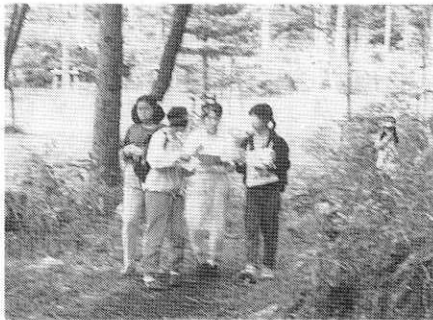
新緑のすがすがしい森の小道にドラマがいっぱい(昨年のウォークラリーで)