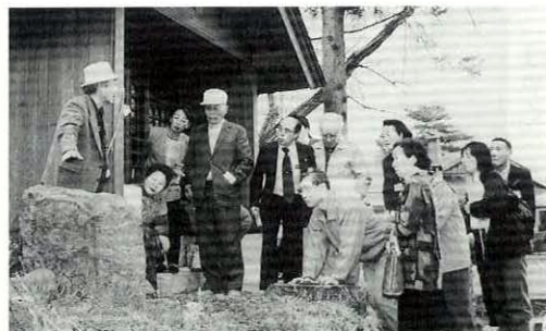
合川にはこんなところもあったんだ

した。口曲がり地蔵については、初めて見るといふ人が多く「新しい合川を発見して、有意義なものになった」と研修の感想を述べていました。