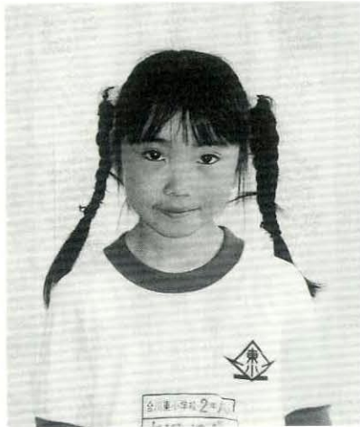
合川東小学校2年生