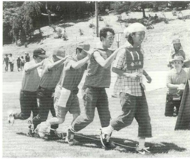
昨年(去年)のあじさいまつり・むかでレース