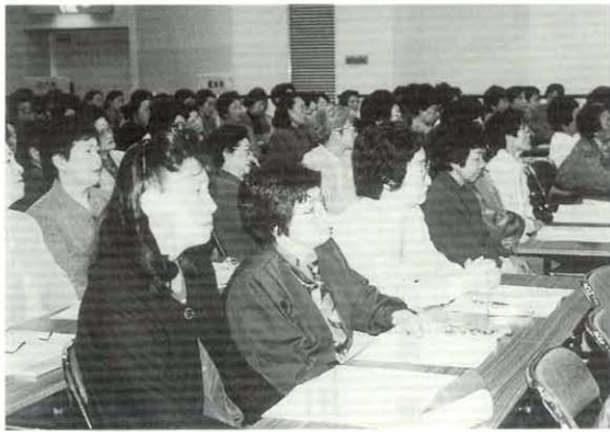
講演を熱心に聞き入る会員のみなさん