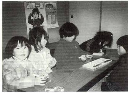
かわいくできるかな？

ターで加熱すると小さく縮んでいきます。子どもたちはその様子をおもしろそうにながめていました。キーホルダーをつけるとみんな喜んでいました。