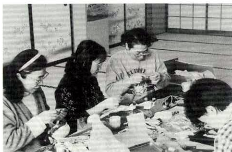
一緒に創作活動しませんか？

メンバーも新しくなり、さらにパワーアップして楽しく活動していきたいと思えます。みなさんも、子どもたちの笑顔にふれてみませんか。ピッコロでは、たくさんの人と仲