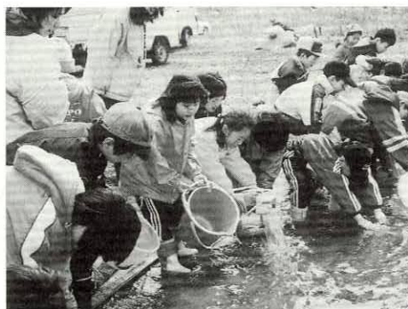
「阿仁川を忘れないでね」

子どもたちは、物珍しそうにバケツの中の稚魚に触れたり、名前を付けて呼んだりしていました。放流後は、長い旅路に向かう稚魚の無事を願いながら、見送っていました。