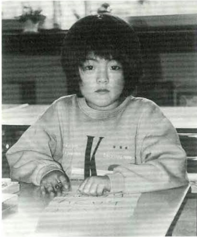
きたほいくえん ゆりぐみ