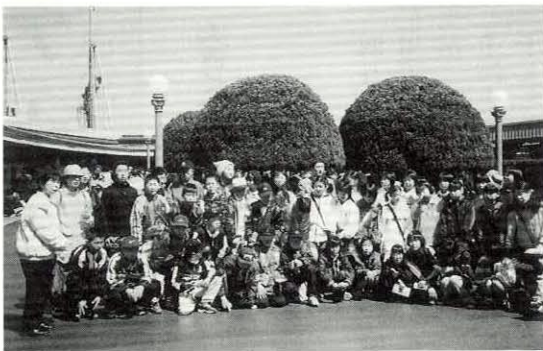
みんな楽しみにしていた東京ディズニールランドで記念撮影

里親との対面では、初対面の人も仲良くなれ、いろいろなことを学びました。ここで学んだことをこれから大切にしていきたいと思