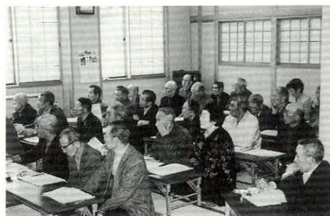
町の歴史についても学習しました

座を通して参加者は「学習したことを地域で生かし、よりよい地域づくりに励みたい」と意欲的な感想を述べていました。