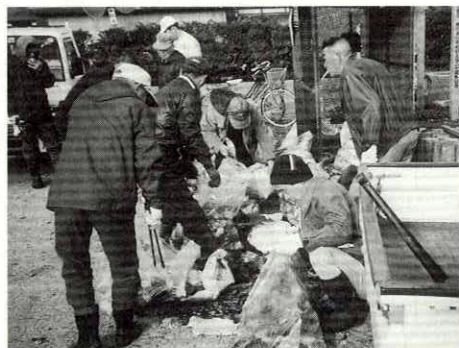
ごみも泣いています

四月四日早朝、全町一斉クリーンアップが行われました。ことぶきクラブや婦人会の皆さん、親子会の活動として子どもと一緒に参加した人などがごみのマナーについて語り合いながら、ごみを拾い集めました。今春は残雪が多く、十一日、十八日に実施した集落もあります。