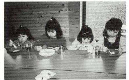
今度お母さんにも食べさせてあげるからね

自分の分を焼いて今すぐにも食べたいとそわそわしていたり、お友だちの作業をじつと見つめたりする子どもたち。紅茶と一緒に食べて楽