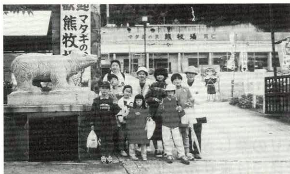
阿仁町熊牧場での親子移動研修会