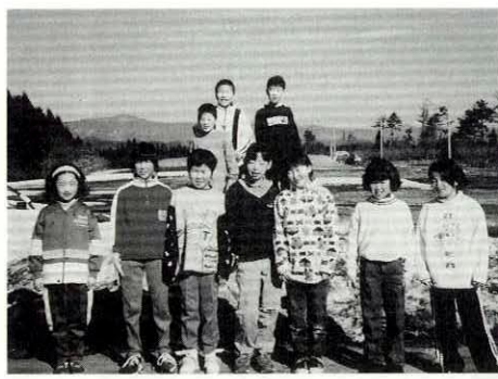
南小の友だちと記念撮影

今年雪だけが遅かったため、しばらくはノルディックスキーも楽しむことができませんでした。南小学校の友だちもセンターに遊びに来ては、にぎやかな笑い声が響いています。また次の春までに、どんなすてきな思い出ができていくのか楽しみです。