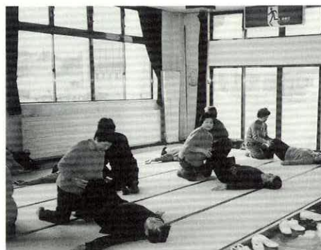
参加自由です。お気軽にどうぞ

健康づくり・笑顔づくりをお手伝いします ◎とき 毎週月曜日午前10時～11時 ◎ところ 保健センター ◎内容 ストレッチ体操、レクダンス、腰痛体操(組み体操)など