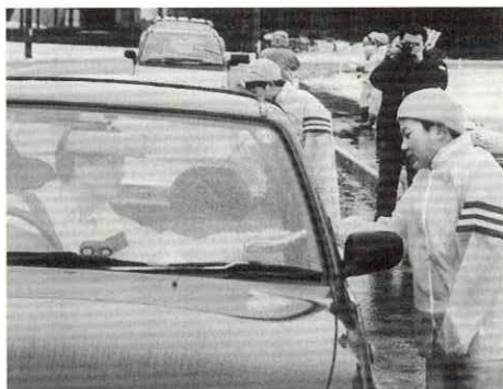
「安全運転をお願いします」

翌朝は、雨の降りつける中、摩当交差点で街頭指導を行い、出勤途中の運転者に児童の手作りのしおりを手渡ししながら、安全運転を呼びかけました。