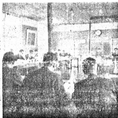
(写真)三月定例町議会

昭和三十四年度予算並に三十三年度決算を審議する三月定例町議会は三月七日より二十日まで十四日間を会期とし三十九議案を審議、原案可決した尙現年度の予算は、七九、六九三、七六九円で、前年度より二、七二〇、七三三円の減を見て居り、大きく支出されるのはなんと云つても土木費の一四、三八九、〇二五円であるが前年度よりは、七、三三五、九七五円の減額とされて、七、三三五、九七五円の減額とされて、七、三三五、九七五円と比較して、一、七五五、一八二円の減額をみている予算並に決算の内容を十分審議された別記に現年度予算一覧表を示す