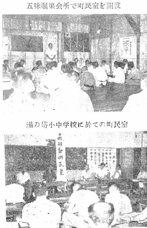
五味堀集会所で町民室を開設

町では、町の円こつな運面に於て開設しました、室であつた 嘗と町民一人、一人の意の開設に当りましては、尚今後は隔月に二、三期見もとり上げ、町発展を町長を先頭に、各主管課所に於て移動町民室を開設したいと言ふ意味から長並係員が参り、町から設する予定です 昨年度より移動町民室の連絡、又はお願等申し町民の皆さんは、是非この開設しているが、八月中上げ部落民のそつ直な意の機会に貴方の御意見を五味堀部落と湯の沢方見を承り、有意義な町民お聞かせ下さい