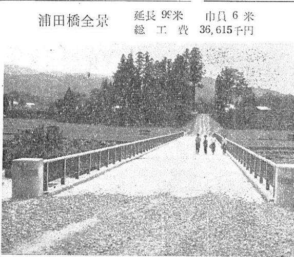
浦田橋全景 延長99米 巾6米 市員6千円 36,615千円 延工費