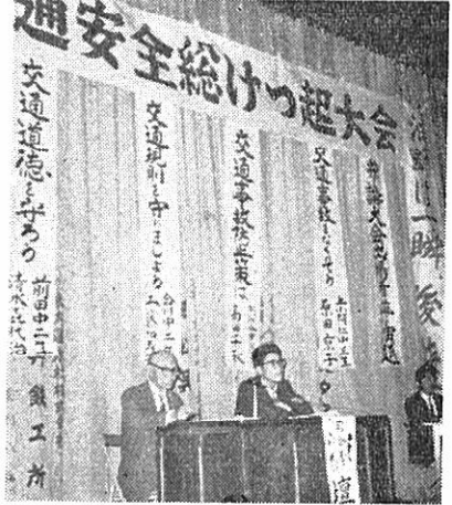
写真上、交通安全総決起大会 (9月21日 米内沢劇場で)

五千年前の土器を発掘 縄文式II(しょうもん式II)前期のもので推定される土器が前田公民館建築現場で整地作業中に発見された。 町教委では関係者の指導、立合いを得て九月十九日二十日の二日間、附近一帯の発掘作業を行い円筒形、つぼ形、かめ形の土器、石錘、スクレーパーなどの石器類を多数発掘しました。 写真上が五千年前の原住民の生活を秘める土器の一部。 下は発掘作業に加賀利男氏撮影。