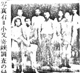
写真 小又奇峽調査の帰途、湯ノ岱温泉に立寄った総務委の一行