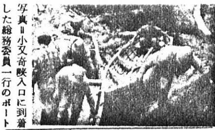
写真 小又奇峽入口に到着した総務委員一行のボート

太平湖をボートで二十分左右的の山々との紅葉に見とれる間に小又奇峽入口に着く、こゝに紅葉時の太平湖は得がたい景観である。昭和二十九年多目的ダムとして完成。