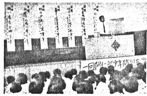
写真は 才一回阿仁部少年防犯弁論大会で挨拶を述べる米内沢警察署長