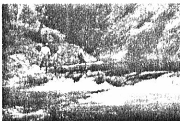
写真 湯ノ岱温泉に立寄った総務委の一行